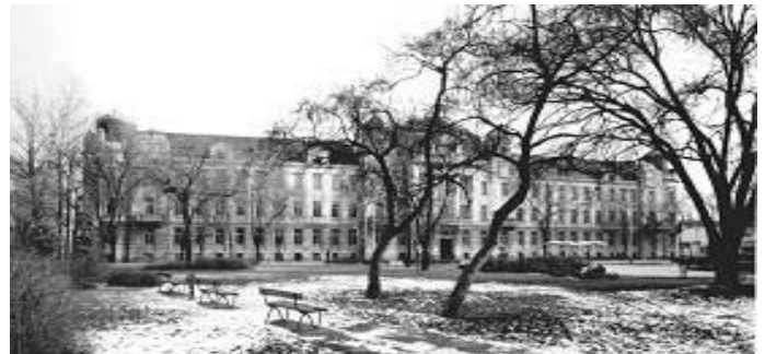
A szabadkai Műszaki Iskola épülete

Sok sikert kívánok a felvételihez, és remélem, mindenkinek sikerül elérnie a célját!