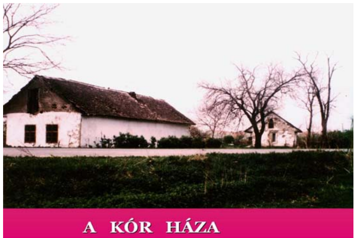
A KÓR HÁZA A VERBÁSZRA VEZETŐ ÚT MENTÉN A MÁIG FENNMARADT "JÁRVÁNYKÓRHÁZ" ÉPÜLETE