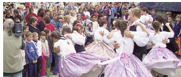
A táncos lábú kicsinyek

A szokásokhoz híven a M.E. néptáncsoportjai feldíszített fogatos kocsikon most is bejárták a falut. Nem csupán a vendéglátó szőlősgazdáknak kedveskedtek alkalmi műsorral, hanem a falu több pontján is megálltak, ahol vagy magánvállalkozók, vagy éppen szomszédok verbuválódtak, akik a műsort követően az ügyes kis táncosokat üdítővel és harapnivalóval kínálták. A fellépőkhöz az idén