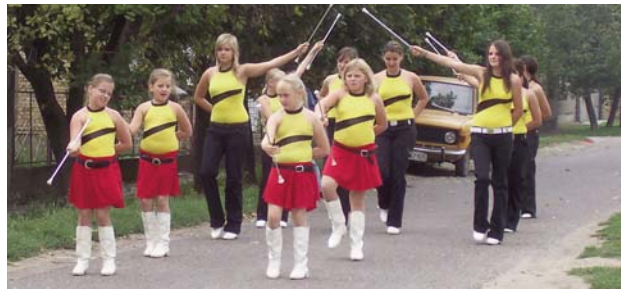
A ruzsai majorettek

Maradékról, Dobradóról, Satrincáról, Ürögről és