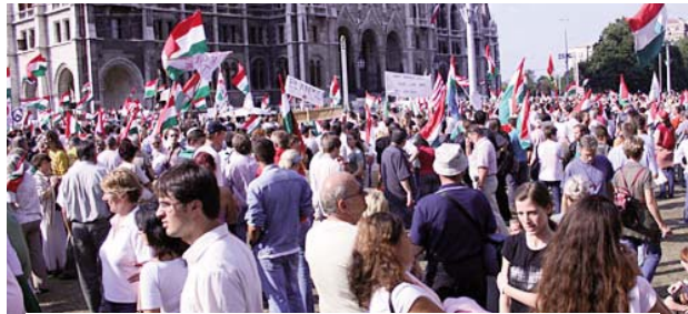
Ötezen a Kossuth téren

Ébred a nemzet? Hogyan kerültünk ide? Hogyan mászhatunk ki ebből a gödörből? Az a véleményem, hogy csak és kizárólag együttes erővel és akkor, ha a fiatalok végre büszkéek lesznek nemzetükre és felmerik majd vállalni azt, hogy mit jelent magyarnak lenni. Talán most eldobta az ország lakosságának nagy része a rózsaszín szemüveget. Talán végre felnövünk ahhoz, hogy egy olyan országot tudjunk teremteni magunknak, amely képes lesz élni és égni.