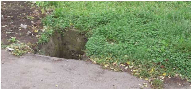
JNA és a Nikola Đurković utca sarka