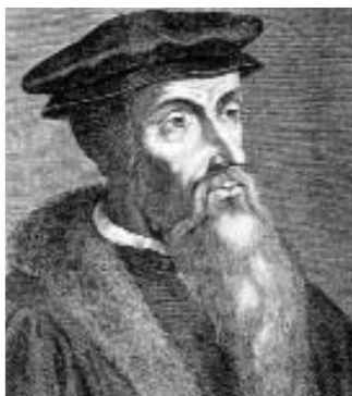
Kálvin János; Jean Calvin (1509-1564)

Hiszük, hogy az üdvösség nem érdemelhető ki jócse-