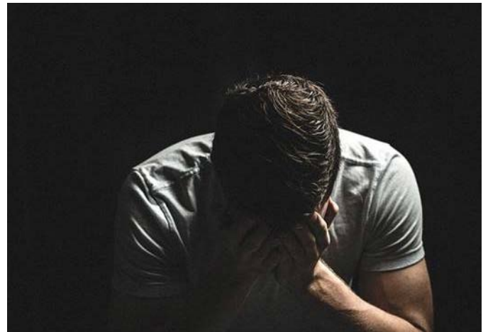
„Ha uralni tudom a boldogtalanságot, nem lesz hatalma fölöttem.” Robert Craig

egészség állapota és összefüggésben áll a testünkben zajló kémiai folyamatokkal is: csökken a stresszhormonok termelődése (pl. kortizol), az alacsonyabb szint csökkenti a gyulladásos aktivitást. Nem csak a stresszhormonok szintje csökken a boldogság megéléséért több hormon is felelős: az endorfin, a szerotonin, az oxitocin és a dopamin. Az endorfin fájdalomcsillapító, az oxitocin csökkenti a feszültséget, a szerotonin jobb kedvre derít, az elégedettségünket a dopamin fokozza. Ezért is érdemes a pozitív