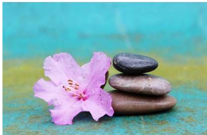
Kép (pixabay) : „A csend meg van áldva azzal a funkcióval, hogy utat mutasson és észhez térítsen.” Papp Ádám

Hová vezet mindez? Kimutatások szerint a zaj, csak Európában 16 600 korai halálesetért és több mint 72 000 kórházi kezelésért felelős évente. Bebizonyosodott, hogy a hosszú távú zajkitettség, expozíció nem csak halláskárosodást, fülzúgást és hangérzékenységet okoz, hanem szív és érrendszeri betegségeket is okozhat vagy súlyosbíthat! Hozzájárulhat a 2-es típusú cukorbetegség kialakulásához