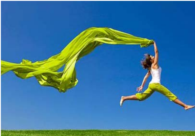
Kép (pixabay): Boldogság: érzelmi állapot, a sorssal és a körülményekkel való teljes elégedettség.

„Az ember feláldozza az egészségét, hogy pénzt keressen. Aztán feláldozza a pénzét, hogy visszaszerezze az egészségét. És mivel olyan izgatott a jövőjével kapcsolatban, hogy elfelejti élvezni a jelent, az ered-