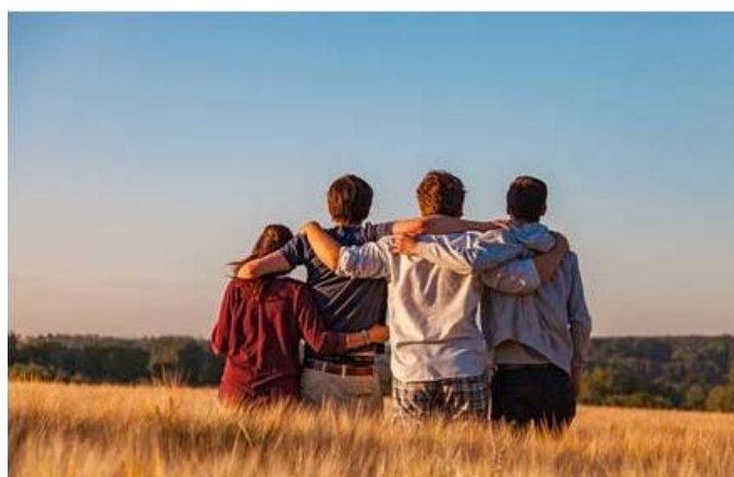
Kép (pixabay): „Mindannyian utazók vagyunk e világ vadonjában, és talán a legnagyobb kincs, amire utunk során akadhatunk, egy őszinte barát.” Robert Louis Stevenson

A hangos, nyugtalanító zajok serkentik, az agynak azt a részét (amygdalát), amely szabályozza a túlélési ösztönöket. Ez mozgósítja a szervezet „harcolj vagy menekülj” reakcióját, amivel a test adrenalin és a kortizol ostrom alá kerül. Anélkül, hogy egyén tudatában lenne, a pulzusszáma és a vérnyomása az erekbe szökik, ami, határozottan, káros mindenki