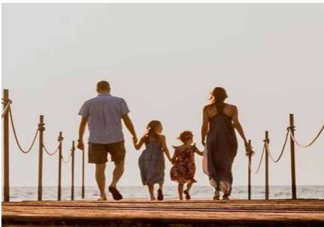
„Ha nincsen erős, elfogadó szeretet férj és feleség, szülő és gyermek között, akkor nincs megértés a nagyobb közösség tagjai iránt sem.” Dean Ray Koontz

mény az, hogy nem él sem a jelenben, sem a jövőben: úgy él, mintha soha nem halna meg, és aztán úgy hal meg, hogy soha nem is élt igazán.” A megelégedés nemcsak egy érzelmi állapot vagy egyfajta pozitív életfelfogás, hanem belső harmónia, testi-lelki